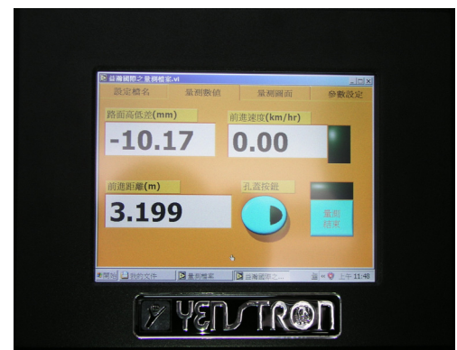
▲ 中文操作觸控式工業電腦